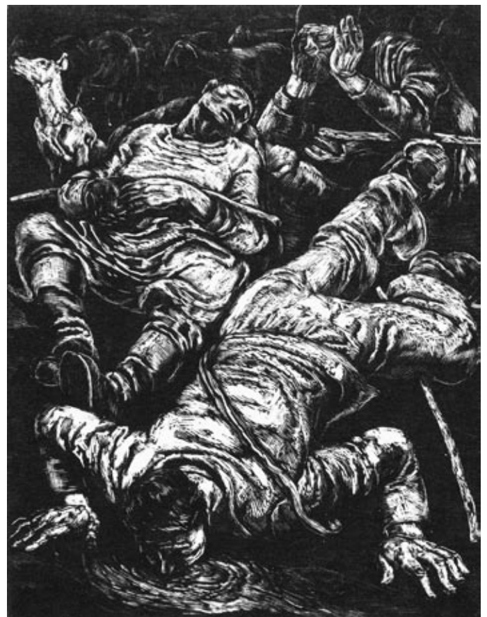
Sosta di pastori, 1950 Xilografia cm 31 X 24 di Mario Delitala Firmata sul foglio in basso a destra Biblioteca universitaria, Cagliariw

– Tacete! – impose finalmente Gavina – voi farete accorrere la